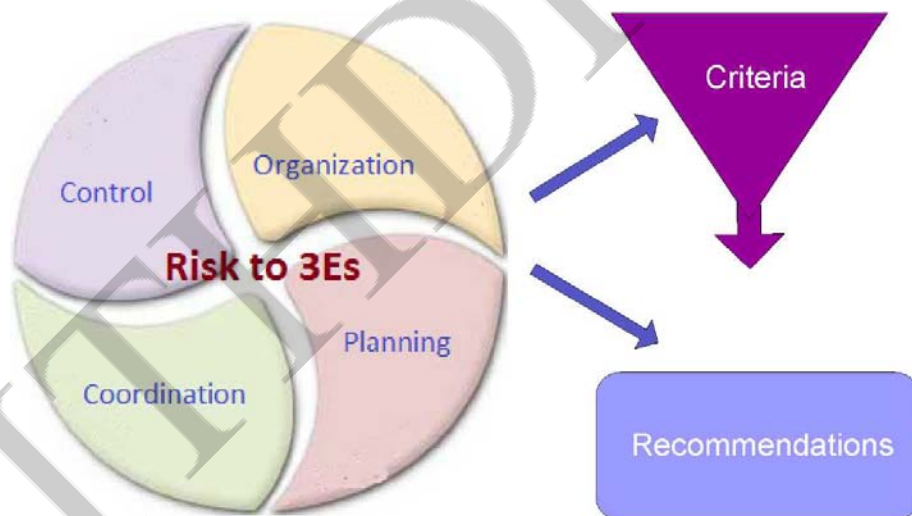
Gráfico 3: Correlación entre riesgos, criterios y recomendaciones